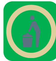
ゴミの回収（ドア前）