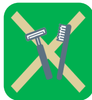
アメニティの交換・補充