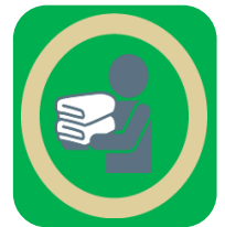
タオル類交換（ドアノブ）