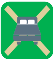
ベッドリネンの交換