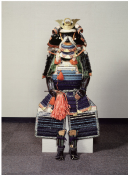
阿部忠秋所用 紺裾濃系威二枚胴具足

阿部家は譜代大名の中でも「安祥譜代」と呼ばれる最も古い時代から徳川家に仕えてきた家系です。時代を重ねるにつれ、複数の家系に別れましたが、分家においても大名に取り立てられ、幕府を担う人材を多数輩出します。